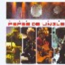
Papas da Língua

Encontre os melhores preços. Clique e compare os preços