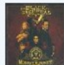
Black Eyed Peas